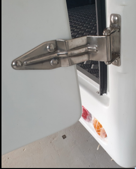
Aluminum Hinge/ Lock