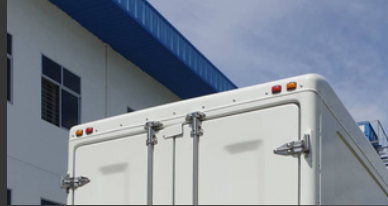
Front/Rear High Mount Lamp