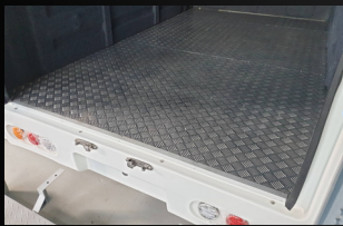
Aluminum Floor (Optional)